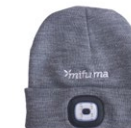
LED-MÜTZE Lichtstärke verstellbar, wieder aufladbar. 60 Punkte