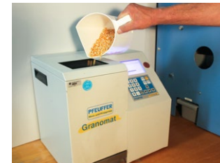
Granomat bei der Bestimmung von Schüttdichte und Feuchtigkeit einer Maispartie

2 Mit unserem Granomat bestimmen wir die Schüttdichte und Feuchtigkeit in sämtlichen Getreidearten, Leguminosen, Ölfrüchten und Mais. Der Feuchtigkeitsgehalt bestimmt, wie gut die Rohwaren lagerfähig sind. Nur trockenes Getreide ist langfristig lagerstabil und gesund. Die Schüttdichte dient als weiterer Indikator für die Qualität des Kornes: Ein höheres Gewicht verspricht auch eine höhere Qualität.