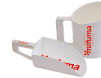
FUTTERSCHAUFEL, FUTTERBECHER jeweils 5 Punkte