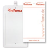
BEWERTUNGS- KARTENHALTER Pappe 15 Stk oder Plastik 3 Stk 8 Punkte