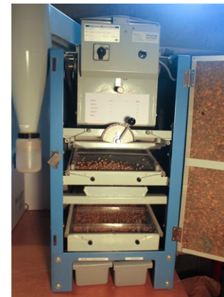
Über die verschiedenen sich bewegenden Siebe des Probenreinigers wird die Qualität der Maispartie überprüft.

Unser Qualitätsmanagement basiert auf der gültigen internationalen Norm ISO 9001. Damit halten wir unsere Leistungen den Kunden und Partnern gegenüber transparent und arbeiten kontinuierlich an der Verbesserung unserer Produkt-, Prozess- sowie Servicequalität.