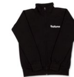
SWEATJACKE NEU mit Fleece Größen: S-4XL 100 Punkte