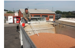
Beprobung einer Partie Milo

1 Zuerst wird eine Probe (1-1,5 kg) der angelieferten Rohwaren gezogen. Hierzu wird mit einem Probenstecher von verschiedenen Stellen und Tiefen des LKW-Anhängers eine Produktprobe genommen. Diese Mischung gibt ein gutes Bild der gesamten Rohwaren-Partie, die wir dann sensorisch prüfen.