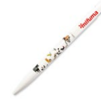
KUGELSCHREIBER 3 Punkte