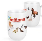
KAFFEEBECHER 17 Punkte