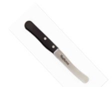
FRÜHSTÜCKS- MESSER 45 Punkte