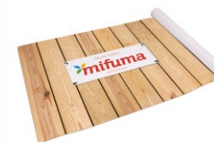
KÄFIGFOLIE Länge: 50 m 45 Punkte