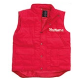
WESTE Größen: S-4 XL 120 Punkte