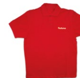
POLO-SHIRT Baumwolle, Größen: S-XXL 30 Punkte