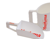
FUTTERSCHAUFEL, FUTTERBECHER jeweils 5 Punkte