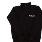
SWEATJACKE mit Fleece Größen: S-4XL 100 Punkte