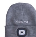
LED-MÜTZE Lichtstärke verstellbar, wieder aufladbar. 60 Punkte