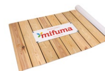
KÄFIGFOLIE Länge: 100 m 90 Punkte