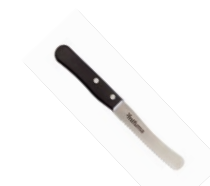
FRÜHSTÜCKSMESSER 45 Punkte