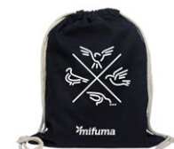
TURNBEUTEL TAUBE „QUARTETT“ Baumwolle 10 Punkte