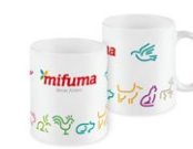
KAFFEEBECHER 17 Punkte