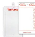
BEWERTUNGS-KARTENHALTER Pappe 15 Stk. oder Plastik 3 Stk. 8 Punkte