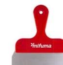
KOT-KRATZER Rostfreier Edelstahl, 16 cm breit. 15 Punkte