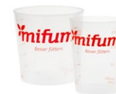
FUTTER-MESSBECHER klein oder groß 3 Punkte