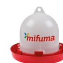
KLEINE TRÄNKE 3 Liter 40 Punkte