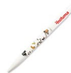
KUGELSCHREIBER 3 Punkte