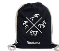
TURNBEUTEL NEU PFERD „QUARTETT“ Baumwolle 10 Punkte