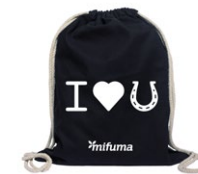
TURNBEUTEL NEU PFERD „LOVE“ Baumwolle 10 Punkte