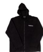
FLEECEJACKE NEU mit Kapuze Größen: S-4XL 100 Punkte