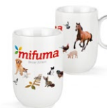
KAFFEEBECHER 17 Punkte