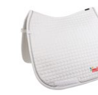
DRESSUR- SCHABRACKE 170 Punkte