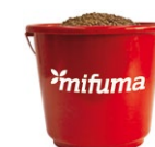
FUTTEREIMER Mit praktischem Deckel. Volumen: 15 l 20 Punkte