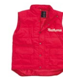
WESTE Größen: S-4 XL. 120 Punkte