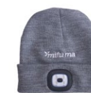
LED-MÜTZE Lichtstärke verstellbar, wieder aufladbar. 60 Punkte