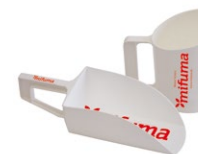
FUTTERMESSEBECHER FUTTERSCHAUFEL Jeweils 5 Punkte