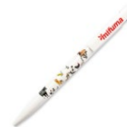
KUGELSCHREIBER 3 Punkte