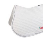
SPRING- SCHABRACKE 170 Punkte

Änderungen vorbehalten. Die von Ihnen übermittelten Daten werden nur zum Zwecke der Zusendung der Prämie verwendet und im Anschluss gelöscht.